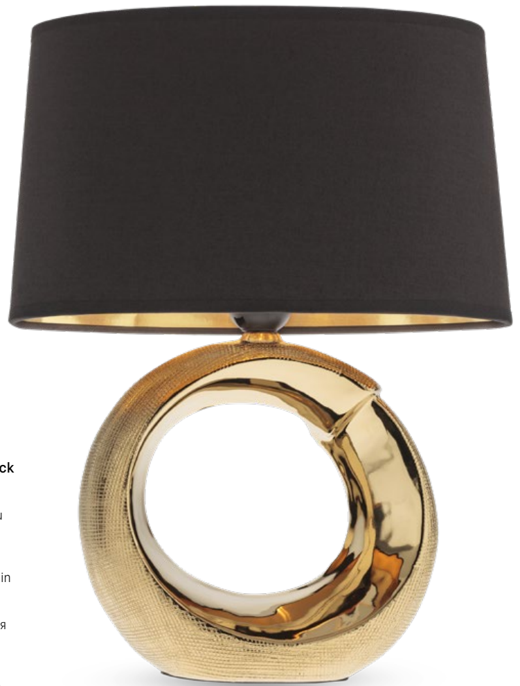
01-1837 Silver 01-1838 Gold