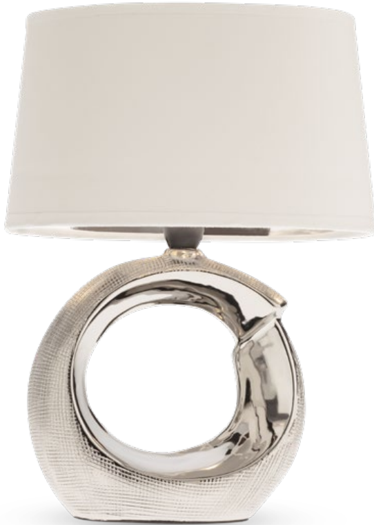
01-1835 Silver 01-1836 Gold