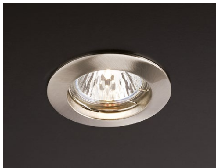
art. 70082 NM Nickel Matt