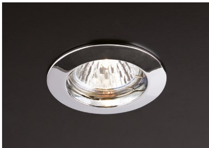
art. 70009 CH Chrome