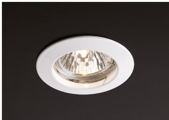
art. 70008 WH White