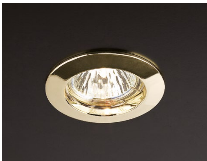
art. 70010 PB Polish Brass